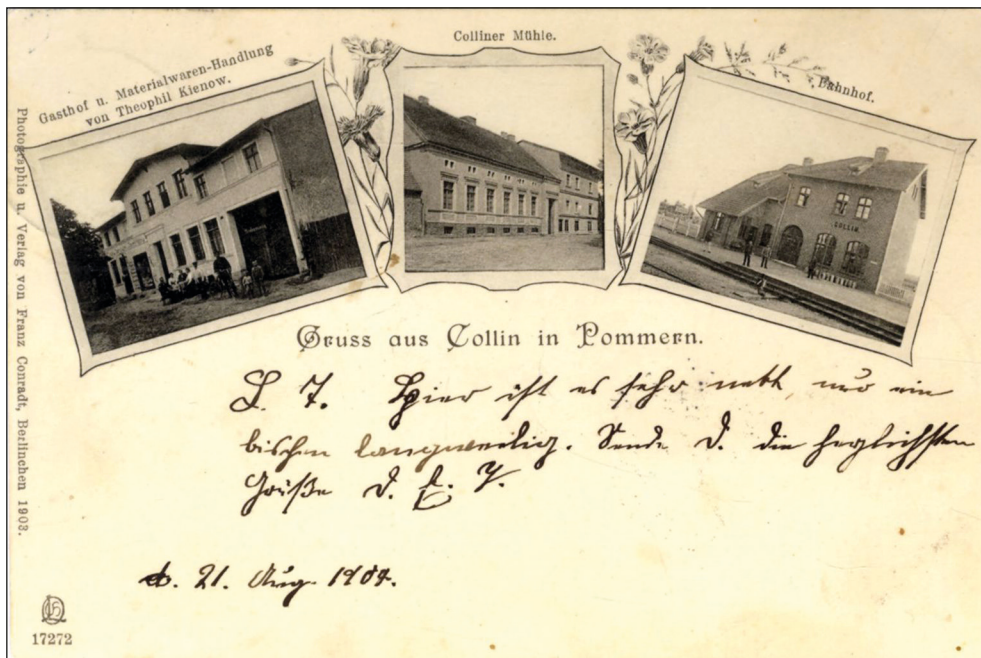
Ryc. 7. Poczтівka; trzywidokowa kartka z Kolina prezentująca zajazd i sklep kolonialny, młyn oraz dworzec, ok. 1904 r.

także nieliczne kartki fotograficzne i litograficzne (ryc. 8). Do zapisywania korespondencji najczęściej używano ołówka i przyborów pisarskich na atrament. Wśród blisko 60 wydawców opisywanych pocztówek kilku działało w miejscowościach znajdujących się na pocztówkach 4 . Pośród przeważającej korespondencji w języku niemieckim można także odnaleźć korespondencję w języku polskim i francuskim.