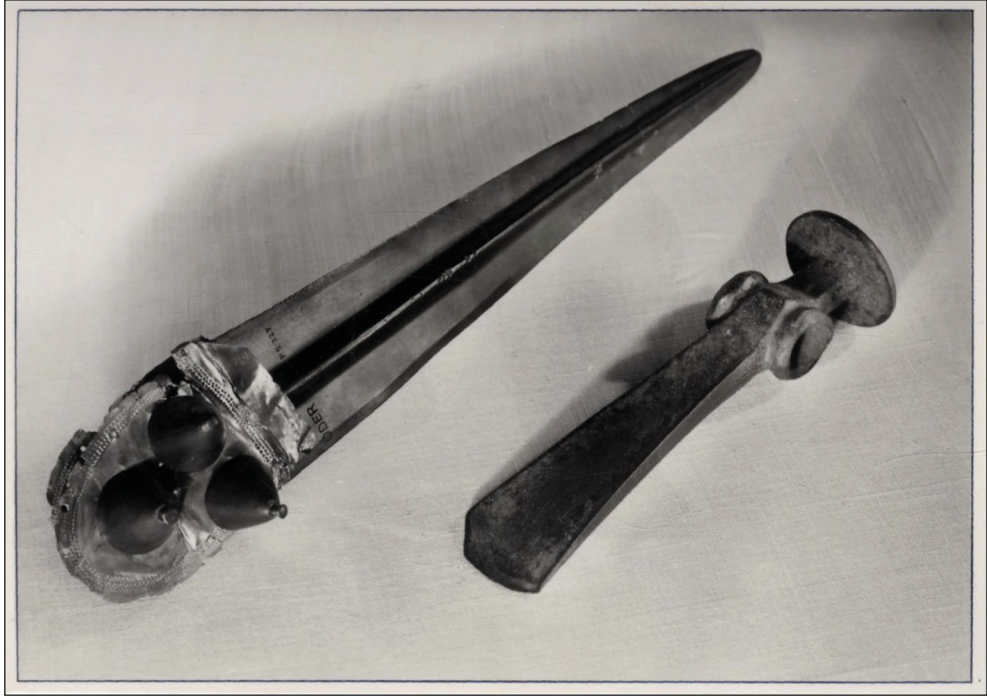
Ryc. 4. Pocztówka; berło sztyletowe z epoki brązu ze zbiorów Pommersches Landesmuseum, Stettin znalezione w Kurcwie, lata 1930–1945. Ze zbiorów MAH w Stargardzie