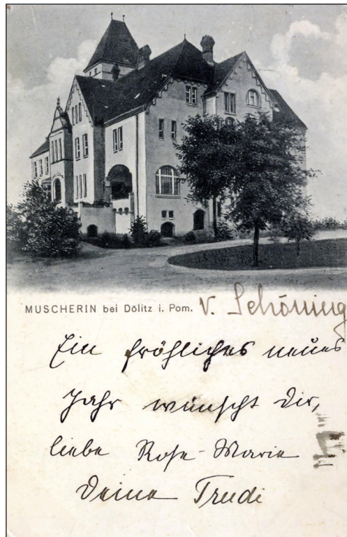
Ryc. 2. Poczтівka; pałac w Moskorzynie, ok. 1907 r. Ze zbiorów MAH w Stargardzie