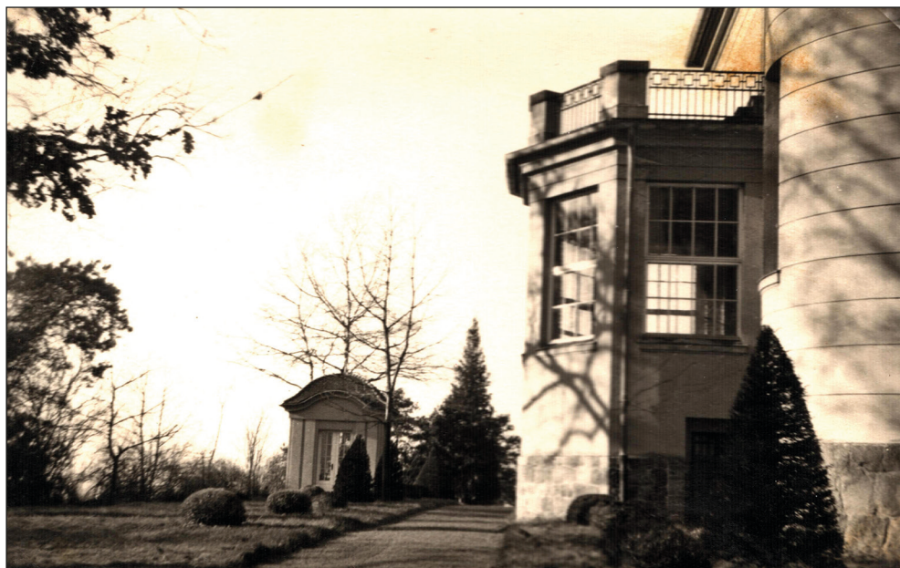
Ryc. 9. Fotografia; widok na domek herbaciany przy pałacu w Koszewie, lata 1941–1943.

W ramach opisywanego zakupu MAH w Stargardzie nabyło również karty albumowe 5 zatytułowane Groß-Küssow krs. Pyritz/ Pommern 1941–1943 bei Seidlers/ Das „Schlossam Meer” z 19 zdjęciami. Wykonane zostały w latach 1941–1943, kiedy majątek w Koszewie był własnością rodziny Seidler 6 . Fotografie prezentują zarówno pałac jak i przyrodę znajdującą się w jego bliskości (ryc. 9) oraz sceny z życia codziennego to-