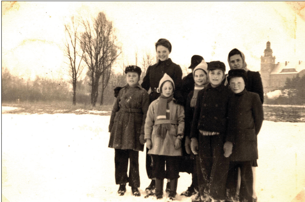
Ryc. 10. Fotografia; na zamrzniętym jeziorze Miedwie, w tle pałac w Koszewie, lata 1941–1943.

czącego się na jego terenie. Są to przede wszystkim ujęcia budynku, drogi prowadzącej do niego wraz z bramą, parku pałacowego i jeziora Miedwie oraz dorosłych i dzieci pozujących do zdjęć ze zwierzętami, wozem konnym, instrumentem muzycznym, a także przebywających na skutym lodem jeziorze Miedwie (ryc. 10). Wspomnieć należy jeszcze także o jednej fotografii dołączonej luzem do zakupu prezentującej grupę żołnierzy przebywających ze sprzętem wojskowym na polach niedaleko Brańęcina datowanej na 1931 r. Stan zachowania fotografii oraz ww. pocztówek jest dobry.