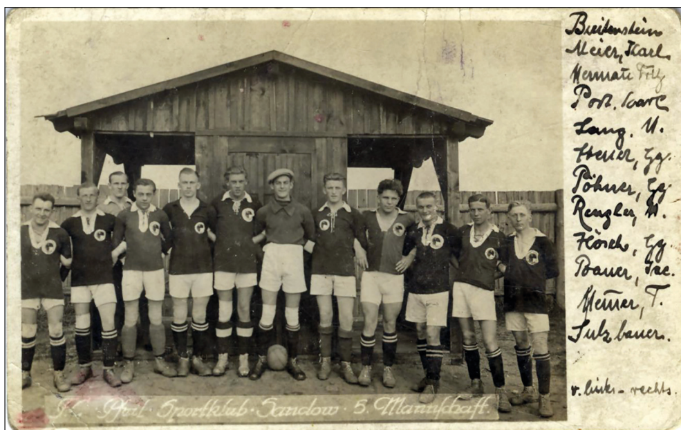
Ryc. 6. Pocztówka; drużyna piłkarska z Sądowa, lata 20. lub 30. XX w.

jowy, hotel, leśniczówka, zakład przemysłowy, most, pomnik poświęcony żołnierzom poległym w czasie I wojny światowej, obóz żeński Służby Pracy Rzeszy, ośrodek szkolenia koni zapasowych na potrzeby wojskowe, dom wypoczynkowy dla dzieci, dom bractwa kurkowego, dom dla pracowników oraz ich rodzin, ulica, jezioro, staw, park. Nielicznie występują wśród nich kartki reklamowe i okolicznościowe oraz karta korespondencyjna. Ciekawostką jest kartka prezentująca berło sztyletowe z okresu brązu ze zbiorów Pommersches Landesmuseum Stettin znalezione w Kurcewie (ryc. 4). W zestawieniu z dotychczasowymi zbiorami unikatową jest kartka pocztowa prezentująca wnętrze pałacu w Wierzchładzie (ryc. 5), gdyż najczęściej tego typu obiekty z mniejszych miejscowości prezentowane były głównie z zewnątrz. Bardzo często w otoczeniu tych budynków oraz miejsc uwieczniono także ludzi, przede wszystkim mieszkańców miejscowości. W niektórych przypadkach, patrząc na stroje, można określić, iż są to pracownicy danego sklepu lub gospody lub też uczniowie szkoły i nauczyciel, gdyż zdjęcie wykonano przed budynkiem szkoły. Wyjątkowa jest także pocztówka, która przedstawia zawodników drużyny sportowej z Sądowa (ryc. 6).