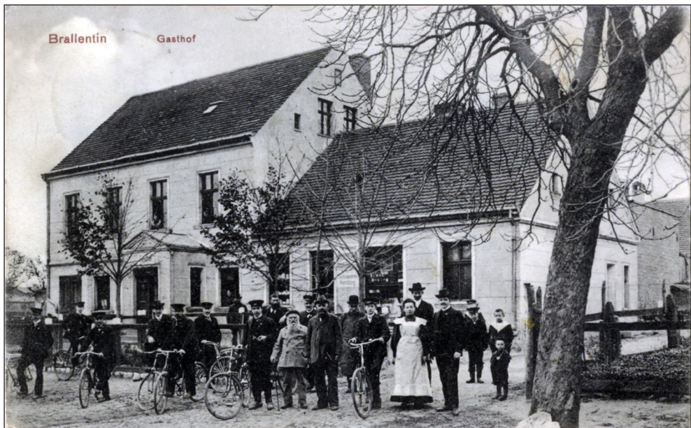
Ryc. 3. Poczтівka; mieszkańcy przed gospodą w Bralęcinie, ok. 1912 r.