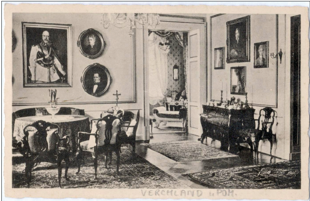
Ryc. 5. Pocztówka; wnętrze pałacu w Wierchłądzie, lata 1905–1945.