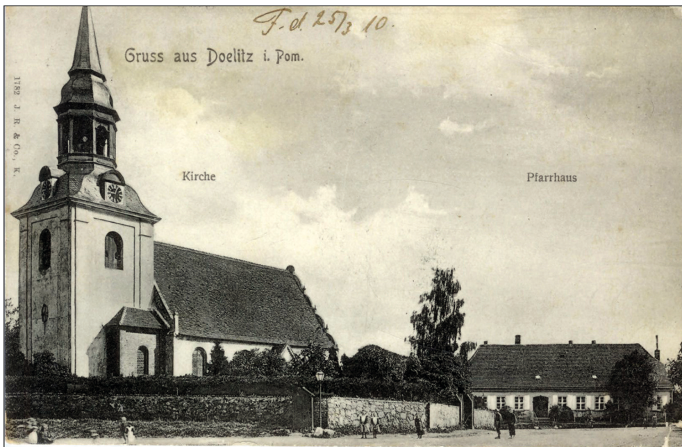
Ryc. 1. Poczta; kościół i plebania w Dolicach, ok. 1910 r.

Omawianie nabytej kolekcji należy rozpocząć od jej części pocztówkowej. Liczy 226 pozycji i stanowi jej znaczną większość. Dotychczasowy posiadacz tej kolekcji gromadził kartki pocztowe z miejscowościami powiatu pyrzyckiego do 1945 r. Po zmianach administracyjnych należą one obecnie do trzech powiatów: choszczeńskiego, pyrzyckiego i stargardzkiego. Prezentują najczęściej najważniejsze i najciekawsze budynki, obiekty i miejsca tychże miejscowości, takie jak kościół (ryc. 1), plebania, urząd, dwór, pałac (ryc. 2), dom mieszkalny, sklep, piekarnia, gospoda (ryc. 3), zajazd, piwiarnia, restauracja, poczta, szkoła, młyn, tartak, cegielnia, cukrownia, spichlerz, dworzec kole-